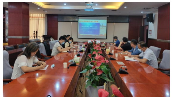
6月17日上午,中共河南省委教育工委、河南省教育厅第三期“能力作风建设年·线上大讲堂”活动以视频会议形式召开,邀请河南省政协人口资源环境委员会副主任、河南省人民政府发展研究中心原主任、河南省社会科学院原院长、二级研究员、经济学博士、博士生导师谷建全作了题为《锚定“两个确保” 实施“十大战略”》的专题报告。我校在行政楼六楼西会议室设置分会场,学校领导班子成员、部分中层干部到会参加培训学习。

通过此次培训,大家纷纷表示,本次培训学习既高屋建瓴,又接地气,做到了理论学习与具体案例相结合、政策文件与实际体验相结合,提供了大量的思想引领、理念创意、方法途径,“既授之以渔,亦授之以鱼”,拓宽了大家的育人视野,增强了工作信心,提升了思想素质和工作作风。同时,将利用好暑假时间充分消化吸收本次培训的主要内容,认真撰写学习总结,做好转化,学以致用,为学校教育教学质量提高贡献智慧与力量,以优异成绩迎接党的二十大胜利召开。(文/毛华中)